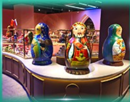
พิพิธภัณฑ์ ตุ๊กตาเป่ลือกก