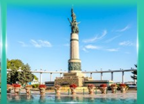
อนุสาวรีย์มังกร