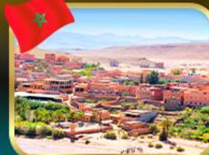
เมือง ไอท์ เบนฮัดดู