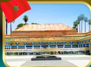
พระราชวังบาเฮีย