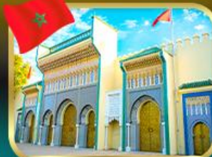
ประตูพระราชวังหลวง