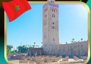
มัสยิดคูตูเบีย มาราเกช