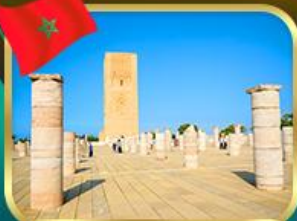
หอคอยอัลฮัน ราบัท