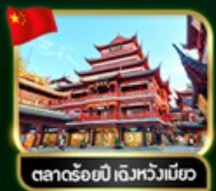
ตลาดร้อยปี เจิวหวังเมี่ยว