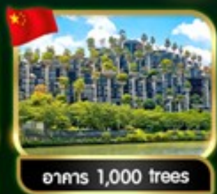
อาคาร 1,000 trees