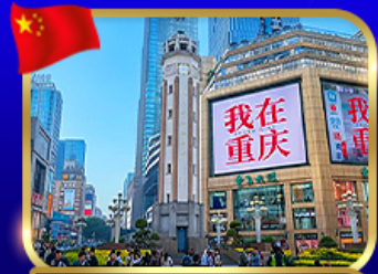
ถนนคนเดินริยฟางเป่ย