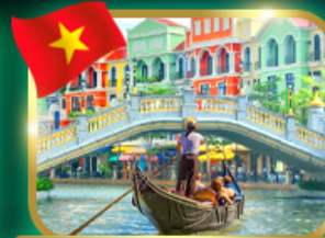
เวนิสจำลอง แกรนด์ เว็ลด์