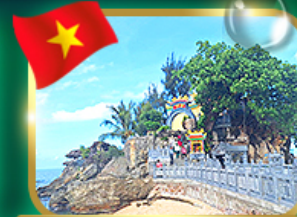
สักการะขอพรศาลเจ้าดิงเกา