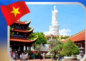
พระโพธิสัตว์กวนอิม วัดโหลว