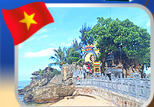
สักการะขอพรศาลเจ้ามังกร