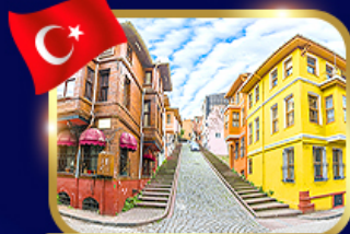
ชมบ้านหลากสี ย่านบาลีก