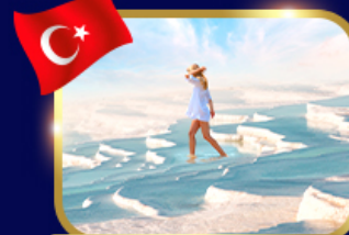
ปราสาทปุยฝ้าย ปามุคคาเล่