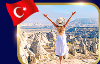
หุบเขาแห่งรัก คัมปาโตเกีย