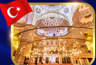
ชมความงามสุเหร่าสีน้ำเงิน