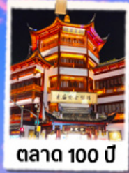
ตาด 100 ปี