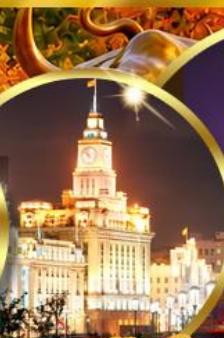
เดอะมันด์