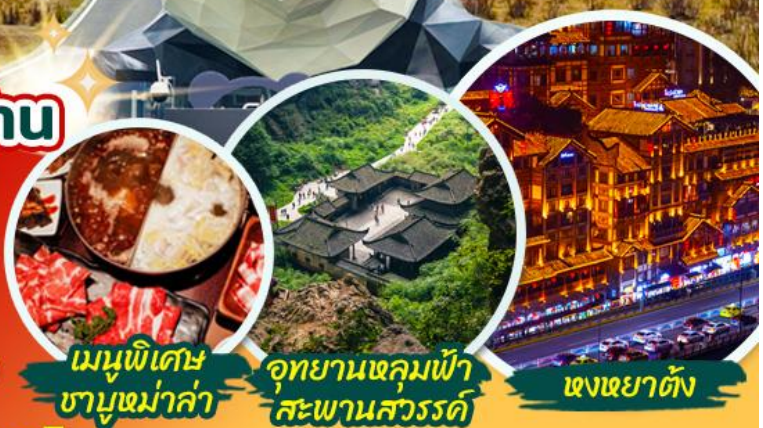
เมนูพิเศษ ชาบูหม่าล่า อุทยานหลุมฟ้า สะพานสวรรค์ หงหยาดัง

**รวมค่าลิฟต์แก้ว รถอุทยาน รถแบดเตอร์ที่เรียบร้อยแล้ว**