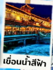
เขื่อนน้ำสีฟ้า

เที่ยวจีน 6 วัน 5 คืน 2 เมืองดัง ทัวร์ลงชิ่ง เจิงตุ เฮาส์ดรุณี