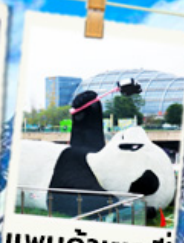
แพนด้าเซลฟี่