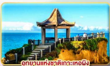
อุทยานแห่งชาติเกาะเหอผิง

เมืองไทเป หรือเทียบเท่า 4* ตามมาตรฐานไต้หวัน