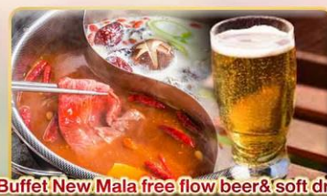
*Buffet New Mala free flow beer& soft drink