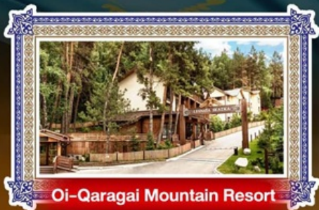
Oi-Qaragai Mountain Resort