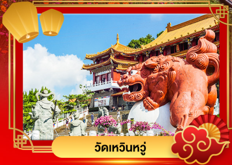
วัดหนิวหนู่