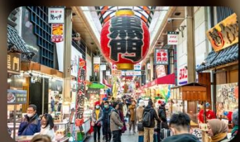
ตลาดปลาคูโรมง