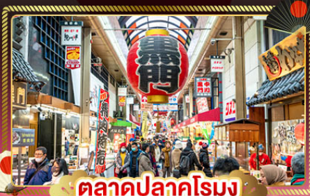
ตลาดปลาคุโรมง