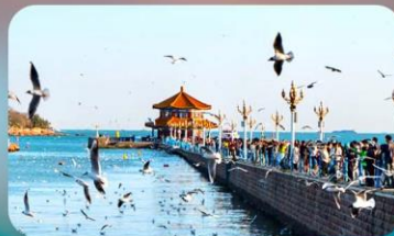
สะพานจันเฉียว