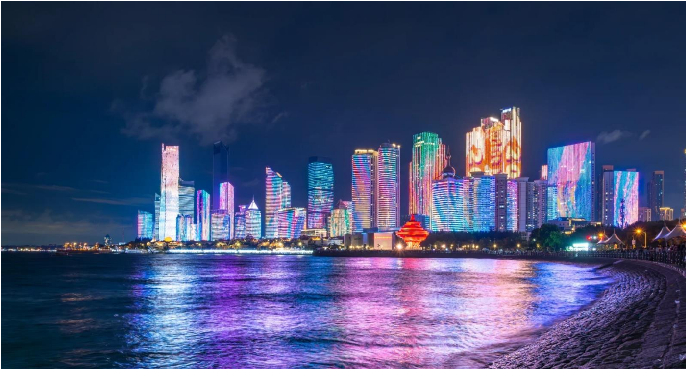
100 หลังเรียงรายตามแนวชายฝั่งที่ประดับประดาด้วยสีอันสดใส

เรือใบโอลิมปิกชิงเต่า ริมอ่าวฟูซาน มีทางเดินเลียบชายฝั่งที่ทอดยาว สามารถเดินเล่นริมทะเลชิลๆ เอนกายบนริ้วเพื่อชมทะเลช่วงพระอาทิตย์ตกดินอย่างเพลิดเพลินและเดินทางไปยังชายหาดสุดไวรัลของเมืองอย่าง ชายหาดไซเบอร์ฟังก์ (NO.3 BATHING BEACH) มีชื่อเรียกอีกอย่างว่า “หาดซานไห่เทียน” ดึงดูดกับเสน่ห์ของชายหาดที่เงียบสงบ เดินถ่ายรูปวิวทะเลในยามค่ำคืน ชมทิวทัศน์มุมกว้างอันยอดเยี่ยมของอ่าวฟูซาน และการแสดงแสงสีของตึกสูงในเมืองชิงเต่า ซึ่งมีอาคารสูงระฟ้ากว่า