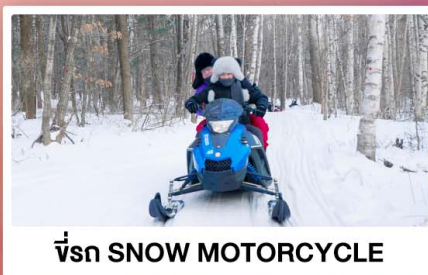
ขี่รถ SNOW MOTORCYCLE