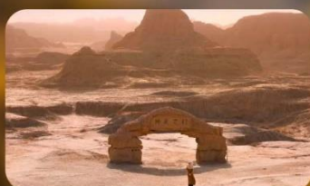
เมืองปีศาจ