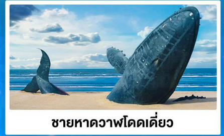
ชายหาดวาฬโดดเคี้ยว