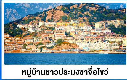
หมู่บ้านชาวประมงซาจื่อโจว