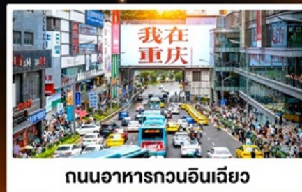
ถนนอาหารถวอนอินเดีย