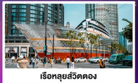
เรือทลุยส์วิตตอง