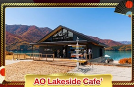
AO Lakeside Cafe'