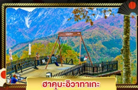
ฮาคุบะอิซากาตะ