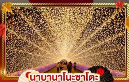
นาคานาโนะซาโตะ

"ชมความงามของฤดูใบไม้เปลี่ยนแล้ว" เที่ยวครบจบทุกไฮไลท์ โอซาก้า-โตเกียว พิเศษ!! บันเทิงแบบ FULL SERVICE