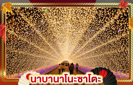
นาคานาโนะซาโตะ

"ชมความงามของฤดูใบไม้เปลี่ยนแล้ว" เที่ยวครบจบทุกไฮไลท์ โอซาก้า-โตเกียว พิเศษ!! บินแอร์แบบ FULL SERVICE