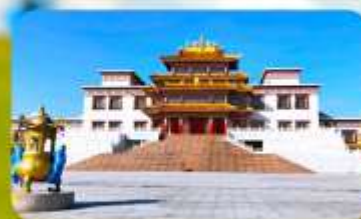
คฤหาสน์พุทธบูชาแห่งชีวิคยูลาน