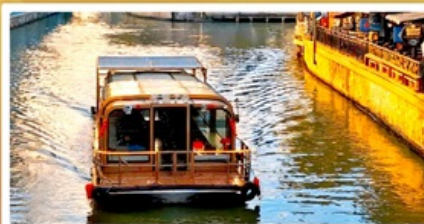
ล่องเรือ Grand Canal