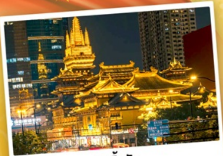
วัดจิ่งอัน