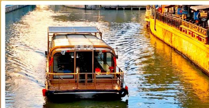
ส่องเรือ Grand Canal