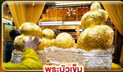
พระบิวเข้ม