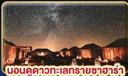
นอนดูดาวทะเลทรายซาฮารา