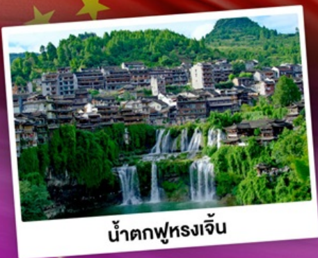
น้ำตกฟุรงเจิ้น