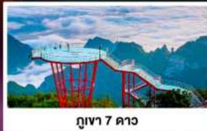
กูยา 7 ดาว