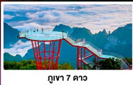
ภูเขา 7 ดาว