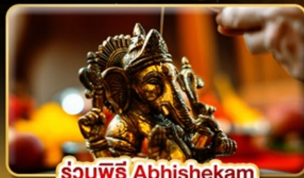
ร่วมพิธี Abhishekam