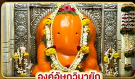
องค์อชฏวินายัก