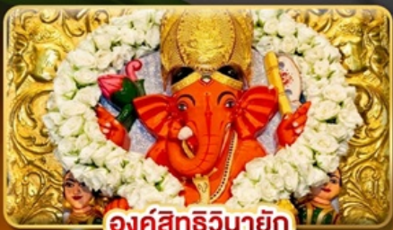
องค์สีทริวินายัก

เปิดรับความสำเร็จ..สักการะ พระพิฆเนศ 10 องค์