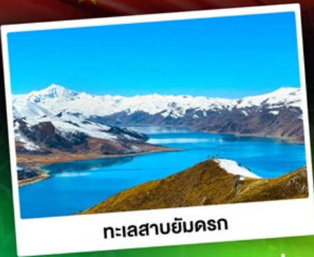
ทะเลสาบยัมดรอก