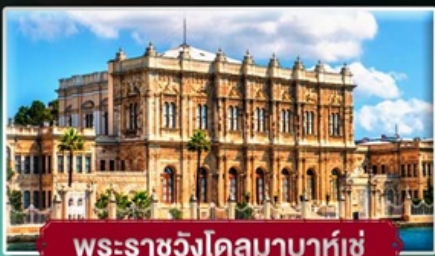
พระราชวังโดลมาบาห์เซ่

สัมพัสดินแดน 2 ทวีป ตุรเคีย ฟรี! ไอศกรีมท่านละ 1 SCOOP