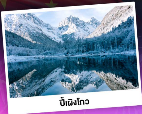
ป่าเผิงโกว

ท่องเขาแอลป์เมืองจีน "ภูเขาสี่ดรุณี" ชมความสวยงามของอุทยานป่าเผิงโกว