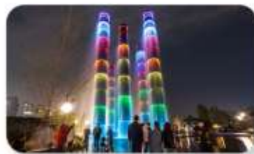
น้ำพุไม้ไผ่