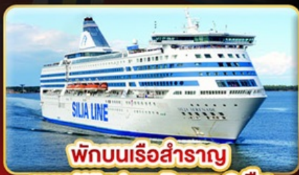
พักบนเรือสำราญ แบบ Window Room 2 คืน