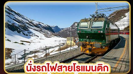
นั่งรถไฟสายโรแมนติก “พร้อมสปา”