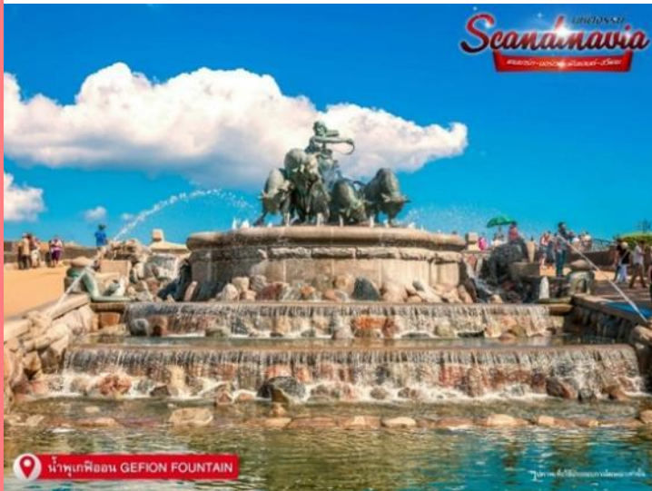
น้ำพุเกฟิออน GEFION FOUNTAIN