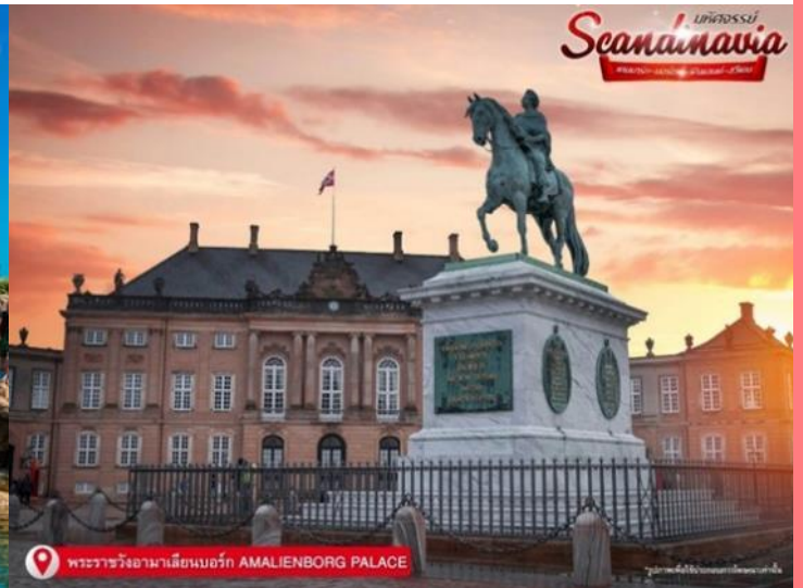
พระราชวังอมาเลียนเบิร์ก AMALIENBORG PALACE

เดินทางสู่ ท่าเรือนูฮาวน์ (Nyhavn) เป็นเขตท่าเรืออันเก่าแก่ของโคเปนเฮเกน ตั้งอยู่ริมฝั่งตะวันออกของตัวเมือง ตามประวัติได้กล่าวไว้ว่า พระเจ้าเฟรเดอริกที่ 5 ทรงรับสั่งให้สร้างท่าเรือใกล้ๆ ตัวเมืองหลวง เพื่อให้สะดวกต่อการขนย้ายสินค้า และใช้เป็นท่าเรือพาณิชย์สำหรับเรือจากทั่วทุกมุมโลกมาเทียบท่า ในวันอากาศดีๆ สามารถเลือกทานอาหารชมบรรยากาศชิลๆ