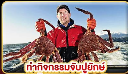
ทำกิจกรรมจับปูยักษ์ “พร้อมเมนูสุดพิเศษ”