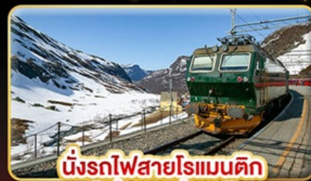
นั่งรถไฟสายโรแมนติก “พร้อมสปา”