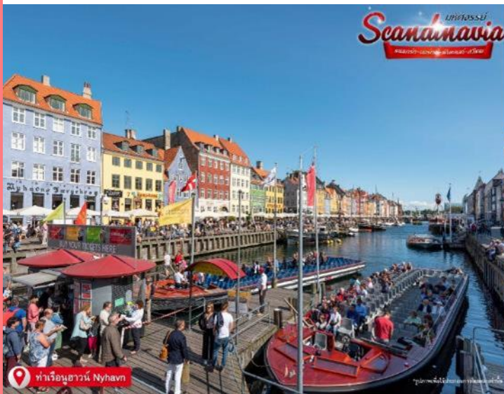
ท่าเรือนูฮาวน์ Nyhavn

เดินทางสู่ ท่าเรือนูฮาวน์ (Nyhavn) เป็นเขตท่าเรืออันเก่าแก่ของโคเปนเฮเกน ตั้งอยู่ริมฝั่งตะวันออกของตัวเมือง ตามประวัติได้กล่าวไว้ว่า พระเจ้าเฟรเดอริกที่ 5 ทรงรับสั่งให้สร้างท่าเรือใกล้ๆ ตัวเมืองหลวง เพื่อให้สะดวกต่อการขนย้ายสินค้า และใช้เป็นท่าเรือพาณิชย์สำหรับเรือจากทั่วทุกมุมโลกมาเทียบท่า ในวันอากาศดีๆ สามารถเลือกทานอาหารชมบรรยากาศชิลๆ