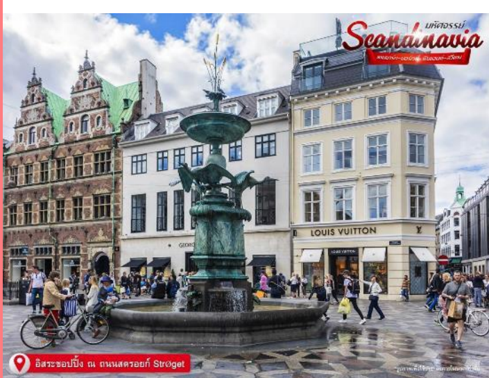
อิสระช้อปปิ้ง ณ ถนนสตรอยก์ Strøget

ให้ท่านได้ อิสระช้อปปิ้ง ณ ถนนสตรอยก์ (Strøget) ถนนคนเดินที่ยาวที่สุดในโลก ร้านบนถนนช้อปปิ้งสายหลักของเมืองนั้นเต็มไปด้วยแบรนด์ดังที่เราคุ้นเคยดี ตั้งแต่ Louis Vuitton ไปจน Urban Outfitter และ Zara ที่ไม่ว่าใครจะเข้ามาแล้วก็เมืองก็สาขา ก็ไม่สามารถหยุดขาตัวเองไม่ให้เดินเข้าไปซ้ำได้ แต่ที่น่าสนใจมากกว่าคือ ร้านของแบรนด์ดีไซเนอร์ท้องถิ่นชื่อดัง อย่าง Wood Wood, Stine Goya, Henrik Vibskov ที่ตั้งอยู่บริเวณนี้เช่นกัน