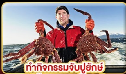
ทำกิจกรรมจับปูยักษ์ “พร้อมเมนูสุดพิเศษ”