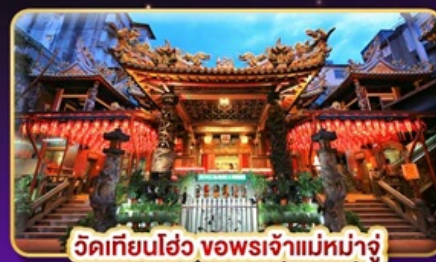
วัดเทียนฮั่ว ของพระเจ้าแม่หม่าจู