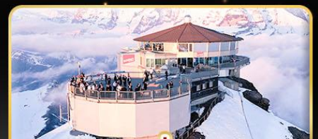
ทานอาหารที่ Piz Gloria ทัศนียภาพที่มองเห็นได้ 360 องศา