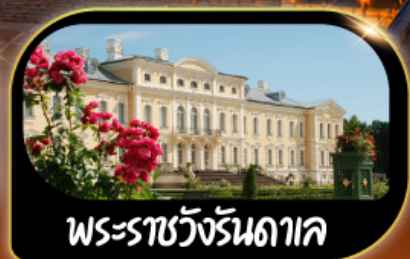
พระราชวังรันทาค