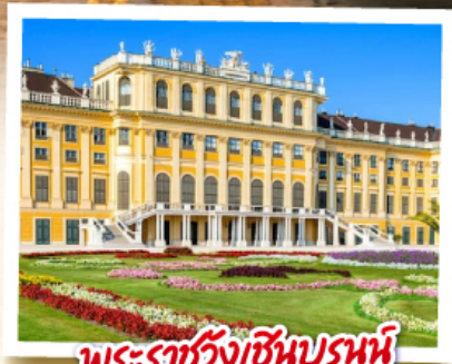
พระราชวังเฮินบรุนน์