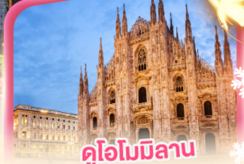
ดูโอโมมิลาน