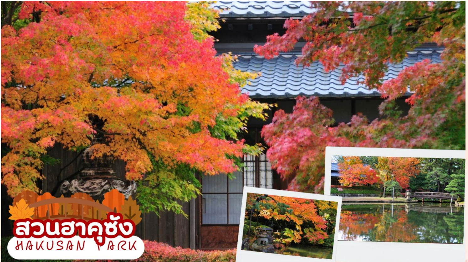
สวนฮาคุซัง HAKUSAN PARK

สวนฮาคุซัง (Hakusan Park) เป็นสวนสาธารณะประจำเมืองนิงะตะ ที่ออกแบบโดยได้รับแรงบันดาลใจจากชาวดัตช์ ตั้งอยู่ติดกับ ศาลเจ้าฮาคุซัง (Hakusan Shrine) และได้รับการยอมรับว่าเป็นหนึ่งในสวนสาธารณะในเมือง 100 อันดับแรกของญี่ปุ่น สวนมีความงามตามฤดูกาลที่หลากหลาย เช่น ดอกซากุระในฤดูใบไม้ผลิ ดอกบัวในฤดูร้อน ใบไม้เปลี่ยนสีในฤดูใบไม้ร่วง และหิมะในฤดูหนาว (ใบไม้เปลี่ยนสีขึ้นอยู่กับสภาพอากาศ)