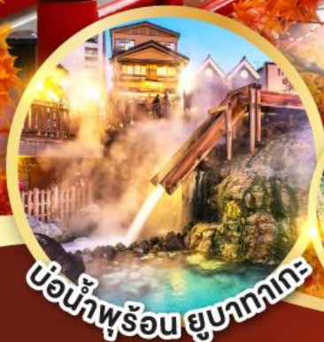
บ่อน้ำพุร้อน ยูบาคาตะ