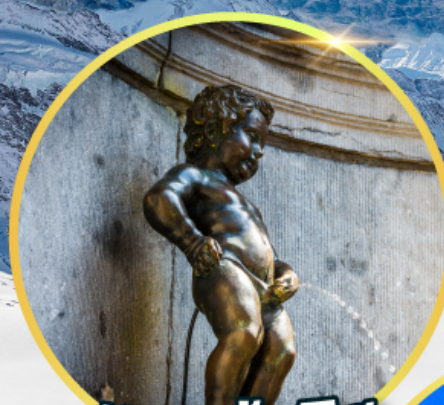
มานกันพิส