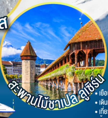
สะพานไม้ชาเปลลูเซิร์น