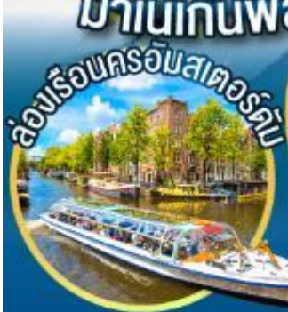
ล่องเรือนครอัมสเตอร์ดัม