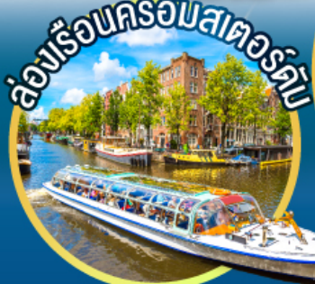
ล่องเรือนครอัมสเตอร์ดัม