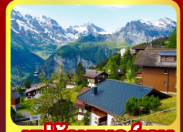
หมู่บ้านเมอร์เรน