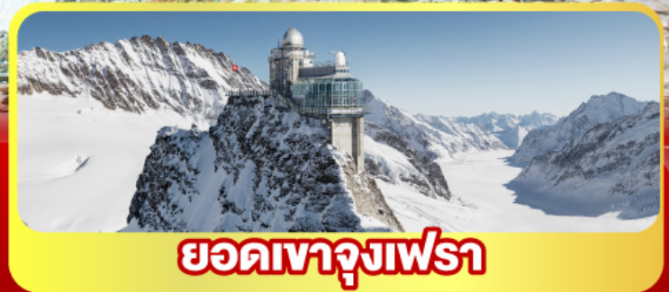
ยอดเทาจุงเฟรา