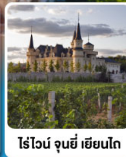
ไร่ไวน์ จุนยี่ เยียนโก