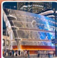
เรือหลุยส์