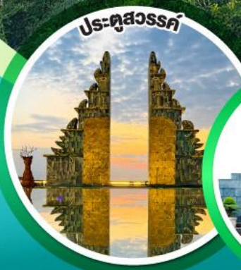
ประตูลสุวรรณค์