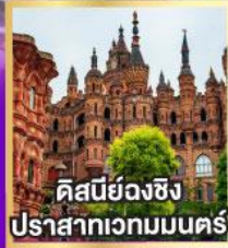
ดิสเนย์ฉงชิ่ง ปราสาทเวทมนตร์