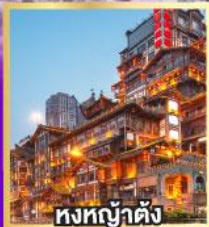
ทงทงต้าตัง

เที่ยวเต็มอิ่ม..ไม่ลงร้านช้อปปิ้ง นั่งรถไฟความเร็วสูง 2 เที่ยว ไม่มีออฟชั่นเพิ่ม