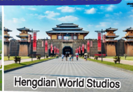
Hengdian World Studios