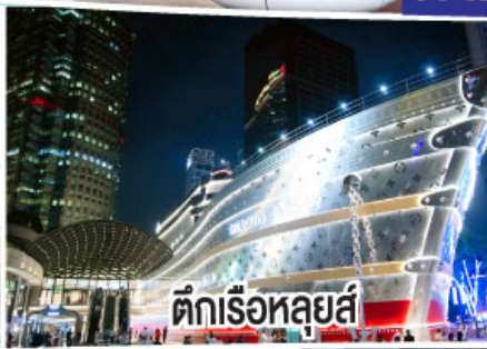
ตึกเรือหลุยส์