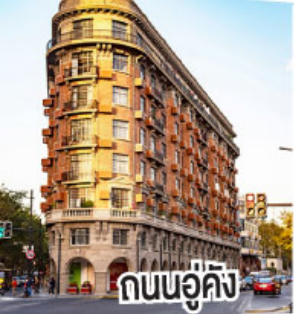
ถนนอู่คัง