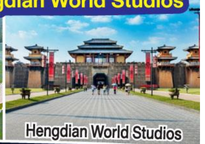
Hengdian World Studios