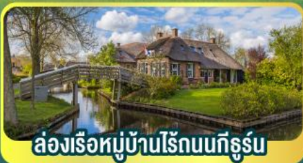
ล่องเรือหมู่บ้านไรน์บนทีกูร์น