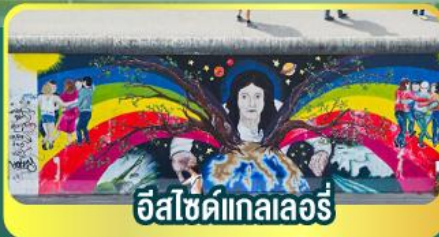
อีสไซด์แกลลอรี่