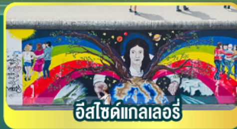
อีสไซด์แกลลอรี่