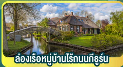
ล่องเรือหมู่บ้านไรน์ทอร์น