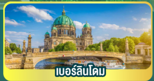
เบอร์ลินโดม