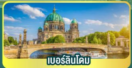
เบอร์ลินโดม