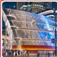
เรือหลุยส์