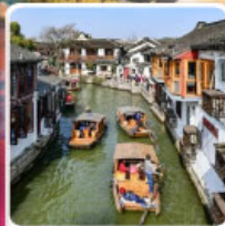
หมู่บ้านโบราณจูเจียเจี๋ย