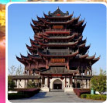
วัดดงหยวน