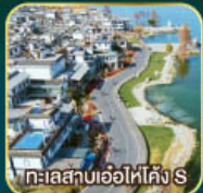
ทะเลสาบเอ้อไห่คัง S