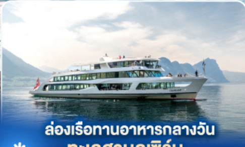
ล่องเรือทานอาหารกลางวัน ทะเลสาบลูเซิร์น