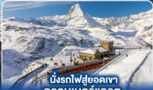
นั่งรถไฟสู่ยอดเขา กรอนเนอร์เกรต