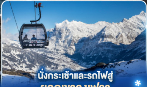
นั่งกระเช้าและรถไฟสู่ ยอดเขาจุงเฟรา